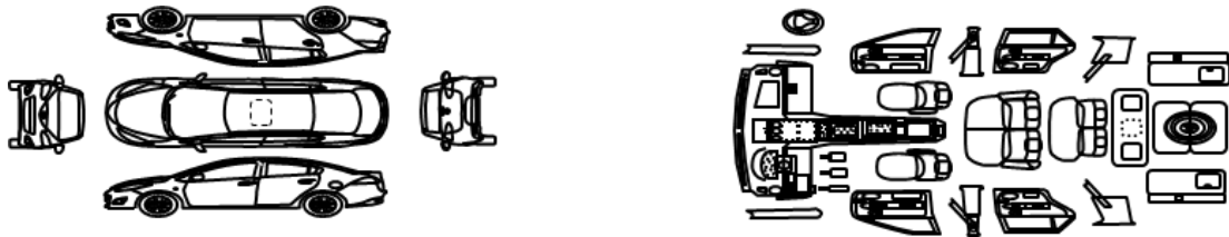
图 A.1 检查结果汇总描述图例